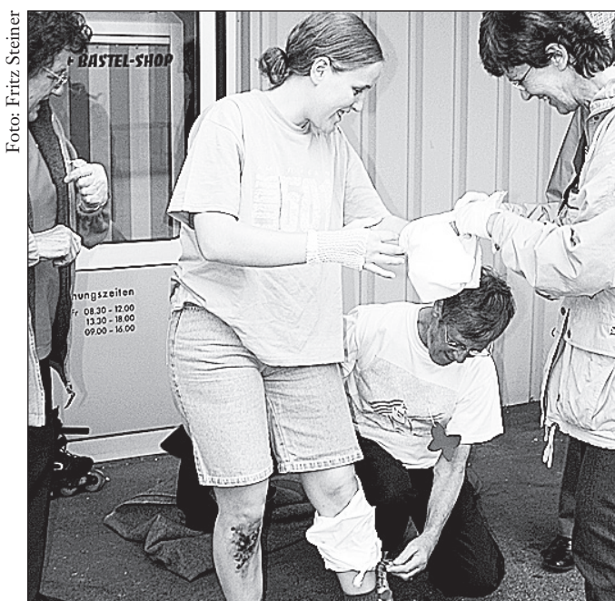
Auch Bagatellen sind Ernstfälle, die es zu verarzten gilt.

An sechs Posten stellten sich etwa 40 Samariterinnen und Samariter den Herausforderungen, die der Samariterverein Oberburg an der diesjährigen Feldübung vorbereitet hatte. Die Vereine Burgdorf, Kirchberg, Hindelbank, Koppigen, Krauchthal, Oberburg, Utzenstorf und Wynigen stellten an den vom technischen Leiter Martin Nyffenegger erstellten Einsatzposten Wissen, Können und Sozialkompetenz unter Beweis. Etliche Figuranten, perfekt und «situationsgemäss» geschminkt und «präpariert», simulierten die vorgegebenen Situationen: Wundbehandlung eines gestürzten Inline-Skaters, Erstversorgung eines verunfallten Velofahrers, situationsgerechtes Alarmieren, Herzmassage. Diese und der Defibrillator konnten am Phantom ausgeführt werden. Gutes theoretisches Wissen war